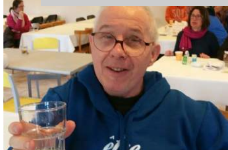
Des sourires et encore des sourires, nous sommes heureux de vivre cela ensemble!