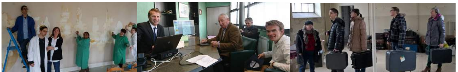
Nous décollons, nous signons puis nous déménageons!