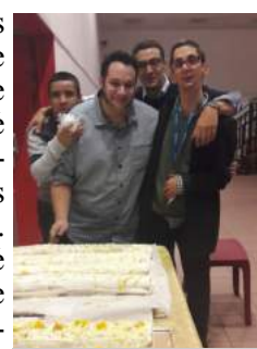
De belles bûches

Pour finir, nous avons eu la joie de partager une danse après avoir admiré nos talents de danseurs (groupe des jeudi après-midi). Ils avaient préparé un spectacle de danse spécialement pour l'occasion. Un régal des yeux!