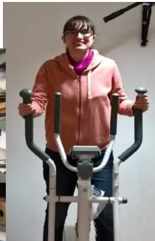
Un peu de sport à la maison de quartier