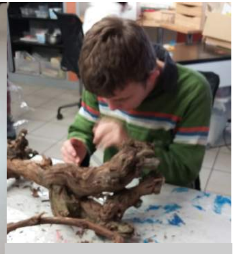
Une activité qui a toujours autant de succès: le grattage de cep de vigne !