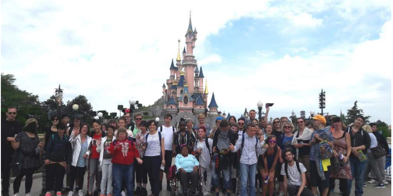
Une sortie à Eurodisney, heureux tous ensemble!