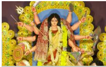
La déesse Durga

Les nombreux bras de la déesse Durga, très vénérée au Bengale, m'évoquent la surabondance de vie et la diversité des facettes de la culture indienne.