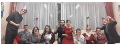
Groupe de vacances à Trosly