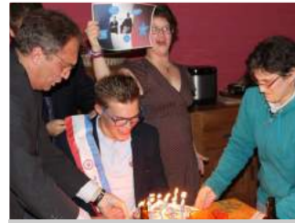
Temps forts au foyer

De nombreux anniversaires célébrés au foyer nous donnent l'occasion de