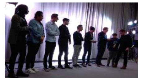
Merci aux étudiants!

« LES MOMENTS PASSÉS ENSEMBLE DEVIENNENT INOUBLIABLES »