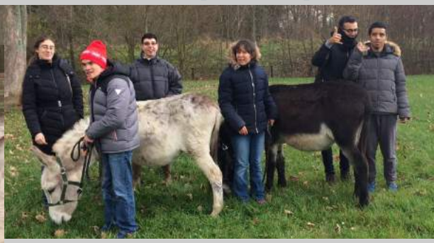
Les ânes ça vous gagne!