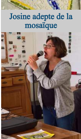
Activité Chant: on donne tout!