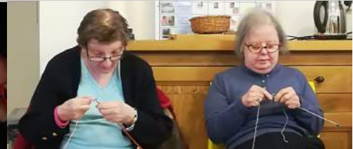
Les tricoteuses de l'extrême!