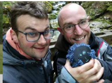
Visite à L'Arche à Grenoble