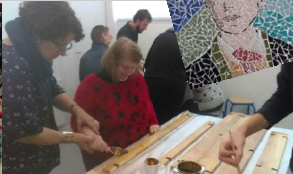
Participation à la confection d'un carré potager à la maison de quartier Orgeval