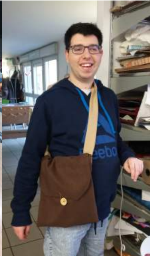
Quelques créations en atelier couture