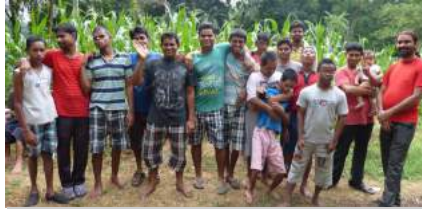
Asha Niketan Asansol, un lieu de vie pour les hommes du foyer

d'agir avec un rapport au temps différent et plus de place donnée à la relation.