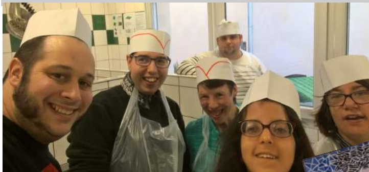
Un groupe pâtisserie plus que motivé