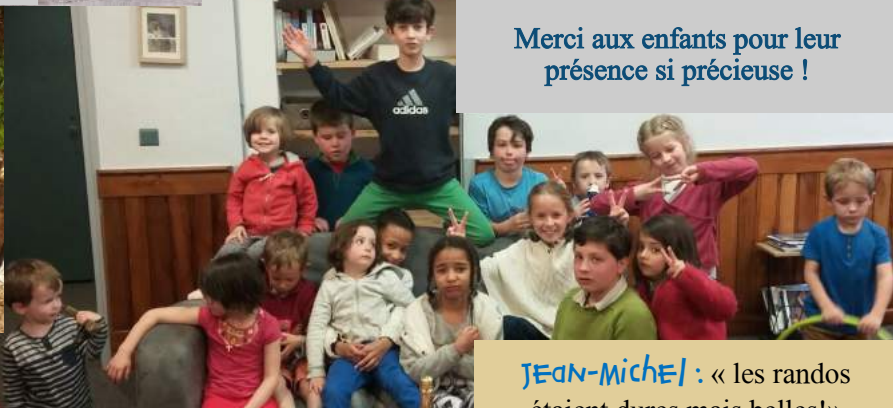
Merci aux enfants pour leur présence si précieuse !

« EN HAUT DES CIMES, ON SE REND COMPTE QUE LA NEIGE, LE CIEL ET L'OR ONT LA MÊME VALEUR ! »