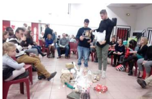
Le temps des Christkind, échanges de belles attentions les uns aux autres

PAR PERRINE DE CHAMISSO, ASSISTANTE AU SAJ