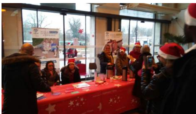
Distribution d'un peu de chaleur et de convivialité!

Alors les discussions ont commencé, certains semblaient déjà connaître L'Arche et ses missions, d'autres apprenaient l'intérêt de l'existence d'une telle entreprise.