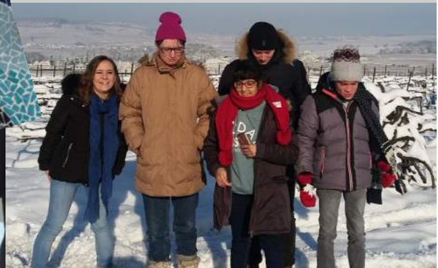
Des balades par tous temps!