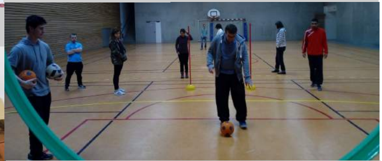
Groupe sports co. à la maison de quartier Wilson